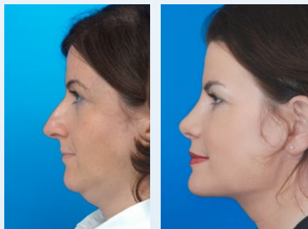
Vor der Operation Nach der Operation